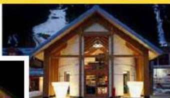
Madonna di Campiglio, Ober 1

via Belfiore 14/C 347 1583695 www.vermouthanselmo.com Lun/Dom, dalle 18. 30