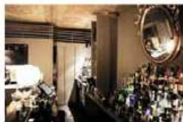
Bologna, Casa Minghetti