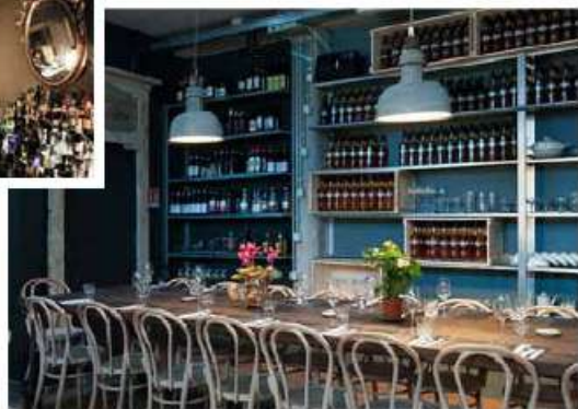
Torino, Vermouth Anselmo