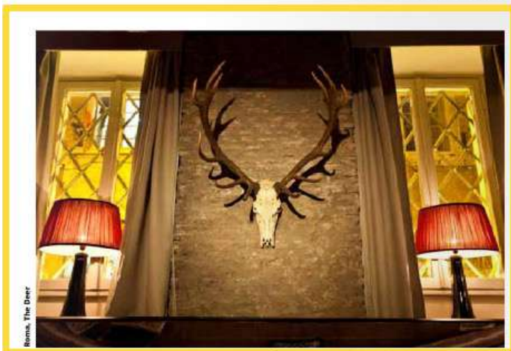
Roma, The Deer